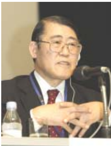
立花 宏 日本経済団体連合会専務理事