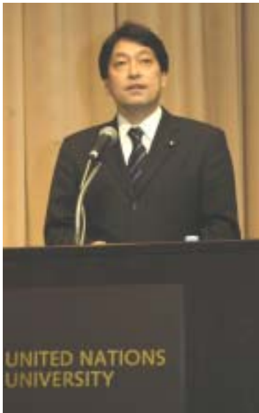
小野寺 五典 外務大臣政務官