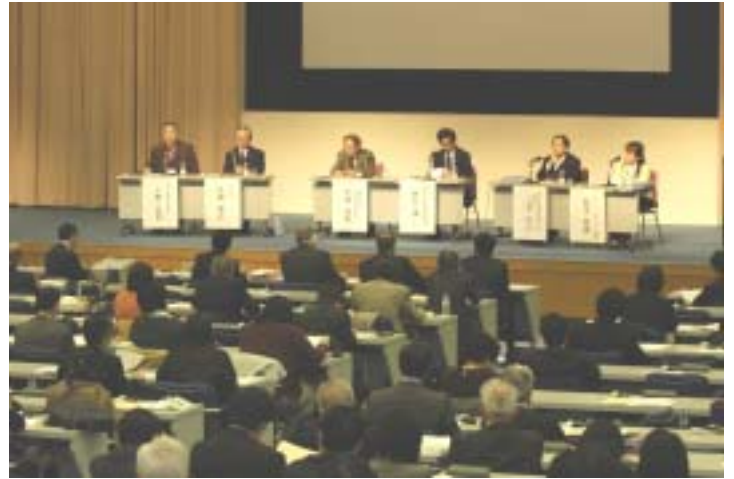
午前の部：パネルディスカッションの様子