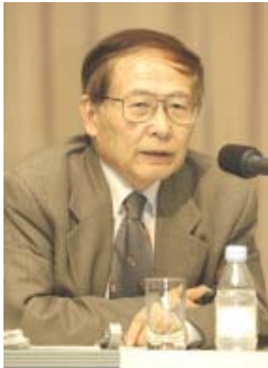
手塚 和彰 千葉大学大学院専門法務研究科教授