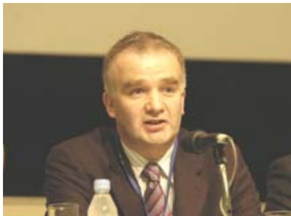
ポール・バーンズ アイルランド司法・平等・法改革省移住政策課長