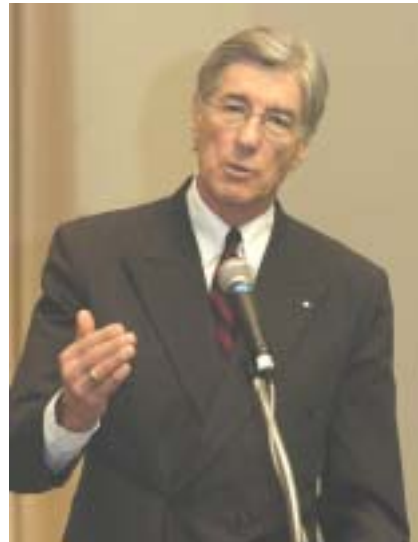
ブランソン・マッキンレー IOM 事務局長