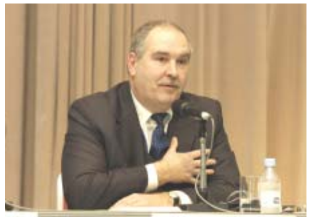
ヴェルナー・ブルカルト ドイツ外務省法務局移民・難民・査証問題担当特任官