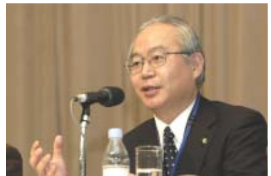
北脇 保之 浜松市長