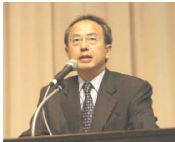
鹿取 克章 外務省領事局長