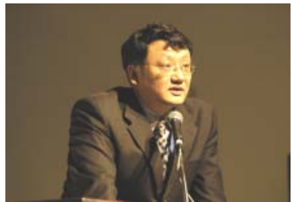
クワン・キソプ 韓国大統領府労働秘書官補